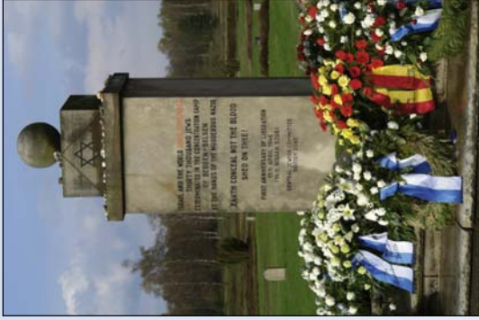
Mahnmal der Gedenkstätte Bergen-Belsen