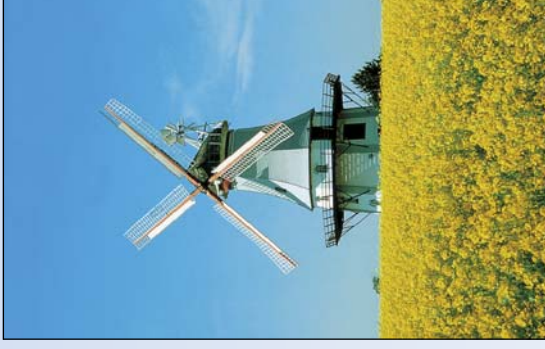
Historische Holzmühle umgeben von gelber Pracht

Information: Infostelle Nordsee-Tourismus-Service GmbH, Tel. 04841/89750, info@nordseetourismus.de , www.nordseekuestenradweg.de