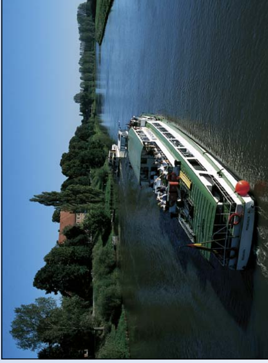
Langsam zieht die Landschaft am Ausflugsschiff auf der Weser vorbei

Egal ob Watt- und Wasservögel, Enten, Gänse, Kraniche und Störche – sie alle finden ihren Lebensraum in den nahrungsreichen Niederungen und offenen Feuchtlebensräumen. So auch der Kiebitz mit seinem weißen Bauch und der auffälligen schwarzen Haube, der Federhölle. Doch nicht nur unberührte Landschaften gibt es zu ergünden. Reizvolle Küstenbadeorte, alte Hansestädte, historische Städtchen und idyllische Dörfer beeindruckten entlang der Strecke und laden zum Besuch ein.