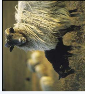
Heidschnucken sind äußerst genügsame Tiere

ADFC Landesverband Hamburg e.V. Koppel 34-36, 20099 Hamburg Tel. 040/393933 www.hamburg.adfc.de