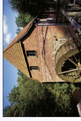
Museum Moisburger Wassermühle