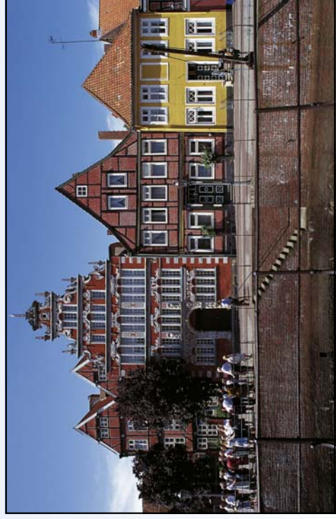
Bürgermeister-Hintze-Haus am Fischmarkt Stade

In Bremen gestartet, kann auf ebener Strecke Kondition aufgebaut werden, bis dann vor Osnabrück die Ausläufer des Wiehengebirges erreicht sind. Die Naturparks Dümmer und Wildeshauser Geest spiegeln die Eigenart und Schönheit der Landschaften in besonderem Maße wieder.