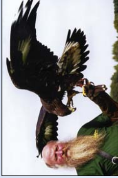
Falkner in der Lüneburger Heide