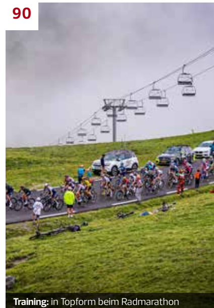
Training: in Topform beim Radmarathon