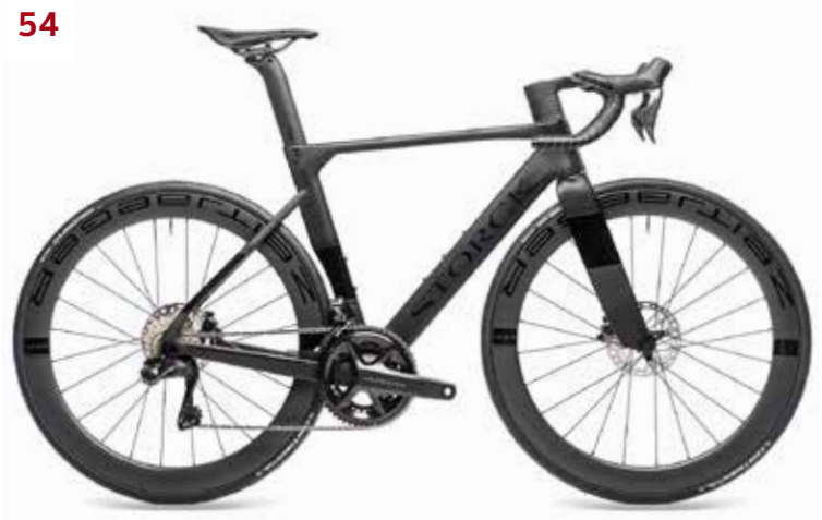
Radtest: acht Aero-Race-Modelle im großen Vergleichstest