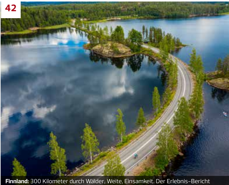
Finnland: 300 Kilometer durch Wälder, Weite, Einsamkeit. Der Erlebnis-Bericht