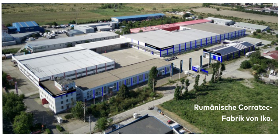
Rumänische Corratec-Fabrik von Iko.