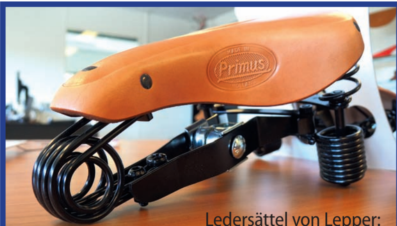
Ledersättel von Lepper: Kuhhaut ohne Kratzer