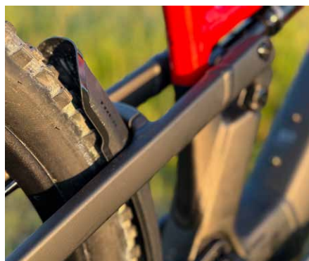
Diskreter Dreckfänger: Das kompakte, schön integrierte Schutzblech vorm Hinterrad.

Auf vielseitige Nutzbarkeit und intensive Biketouren getrimmt haben will US-Anbieter Trek sein E-Tourenfullly Powerfly+ FS. ElektroRad hat dem Topmodell Powerfly+ FS 8 auf die Stollen gefühlt und klärt, wie viel Action- und Spaßpotential es besitzt.