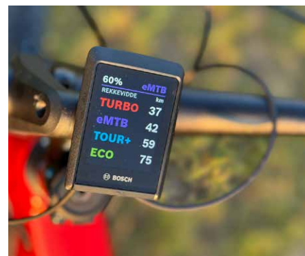
Sehr gut ablesbar, thront das Bosch-Display Kiox 300 über dem Lenker.

In jüngster Version rollt das Powerfly+ FS zur flüssigen Überwindung auch größeren Terrains auf großen 29"-Laufrädern/-Pneus. Ausgenommen davon ist die Größe S; hier setzt Trek für Top-Agilität, lebendiges Handling und geringe Überstandshöhe bei kleinen Fahrern auf 27,5"-Laufräder. Um am Volant des E-Touren-/Trailfullys zügig gen Gipfel zu streben, verbaut US-Anbieter Trek die neu-