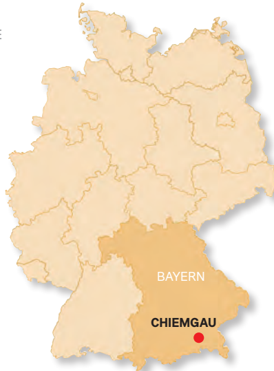
DER CHIEMGAU ist einer der schönsten Flecken Oberbayerns und ein perfektes E-Mountainbike-Revier.

Gerade mal dreißig Minuten von der bayrischen Hauptstadt entfernt, beginnt unsere #RideLocal Tour. Nein, man muss nicht die S8 zum Flughafen München nehmen, wo normalerweise stündlich rund 90 Flugzeuge starten und landen. Entspannt geht