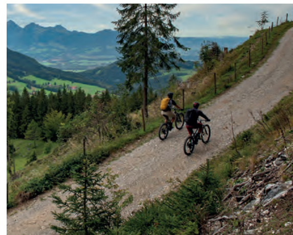
UNSERE ERSTE ETAPPE führt über den Innradweg nach Süden. Geroutet werden wir von unserem Smartphone.